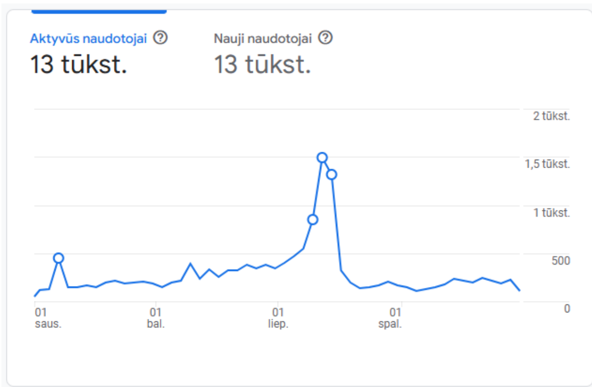
1 diagrama. Visitvisaginas.lt internetinės svetainės lankytojų skaičius nuo 2025 m. sausio 1 d. iki 2025 m. gruodžio 31 d.